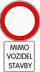
DODATKOVÁ TABULKA KE ZNAČCE B1

PROVEDENÍ ZNAČEK: RETROREFLEXNÍ ČSN EN 12899-1 VELIKOST DOPRAVNÍCH ZNAČEK: ZÁKLADNÍ VL 6.1 A VL 6.2