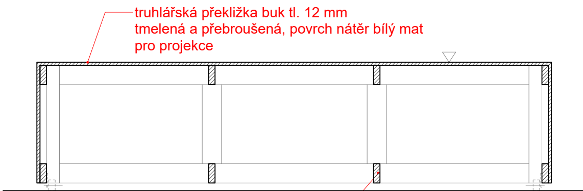
ŘEZ C - C

truhlářská překližka buk tl. 12 mm tmelená a přebroušená, povrch nátěr bílý mat pro projekce