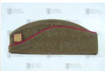
čs. vycházková čepice, 1930