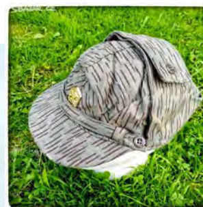
čepice vz. 60