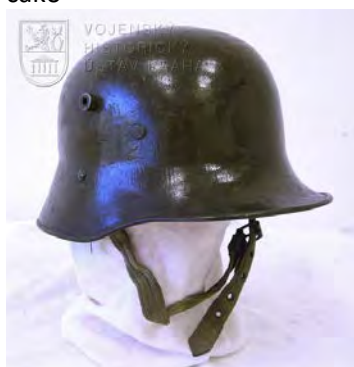
R-U helma 1917