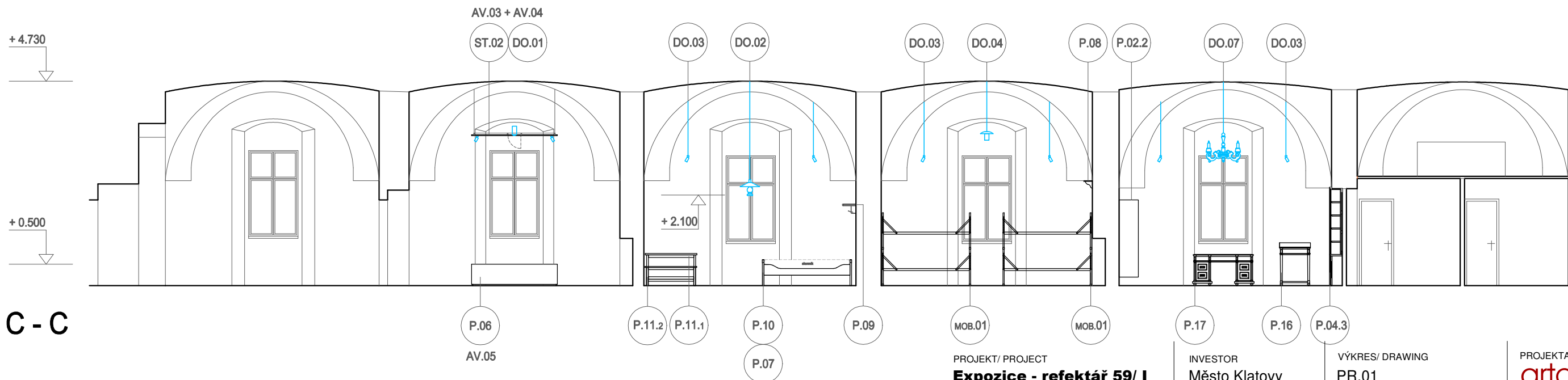
C - C

PROJEKT/ PROJECT Expozice - refektář 59/ I reg.č.CZ.06.3.33/0.0/0.0/16_059/0004666