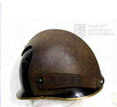
upravená helma pro jezdecktvo 1915