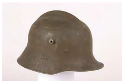
čs. helma vz. 20